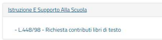
Fig. 4 – Stralcio Schermata “Istruzione e Supporto alla Scuola”