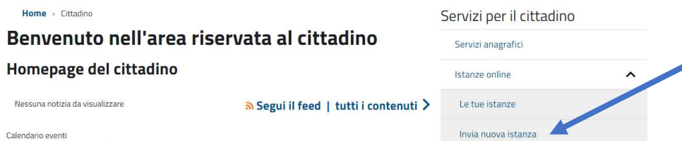
Fig. 3 – Stralcio Schermata Area Riservata al cittadino