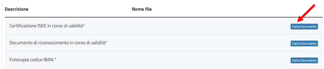
Fig. 10 – Stralcio Campo “Documenti”

10. Caricare tutti i documenti richiesti, secondo le indicazioni ed in base a quanto riportato nell’avviso pubblico e nelle relative sezioni informative, attraverso il pulsante “Carica Documento”: