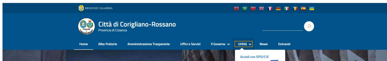
Fig. 1 – Stralcio Pagina Home del Sito